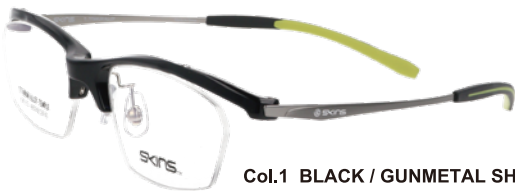
Col.1 BLACK / GUNMETAL SHIRRING