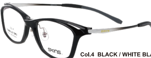
Col.4 BLACK / WHITE BLACK GRADATION