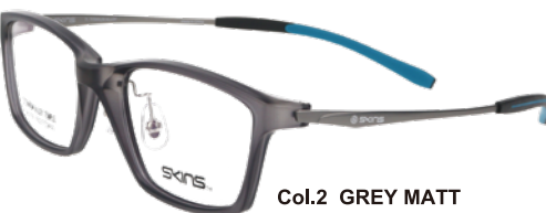
Col.2 GREY MATT